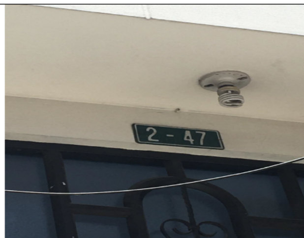
Fotografía No 2. Nomenclatura urbana.