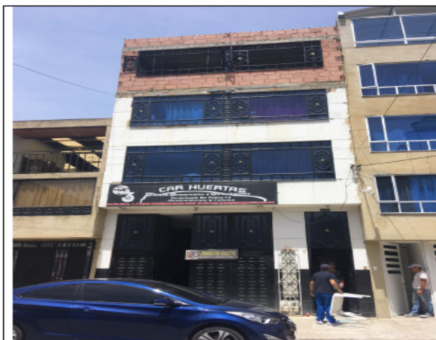
Fotografía No 1. Fachada del Predio.

Al momento de la visita se encontraban laborando a puerta abierta, no se percibieron olores al exterior del predio dado que no se realizaban actividades de soldadura o pintura como tampoco se evidencio uso de espacio público para desarrollar actividades propias del establecimiento.